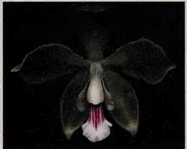
Comparaison E. paraensis – E. pachyantha